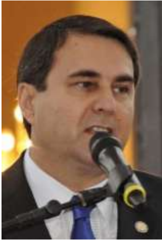
Federico Franco, presidente de la República.

Franco busca reiniciar venta de carne vacuna a Taiwán -- El presidente Federico Franco buscará reiniciar la exportación de carne vacuna a Taiwán. En la agenda de su visita, sin embargo, no se contempla la posibilidad de plantear alguna renegociación del crédito chino de US$ 400 millones, despilfarrado en el gobierno de Luis González Macchi (ANR).